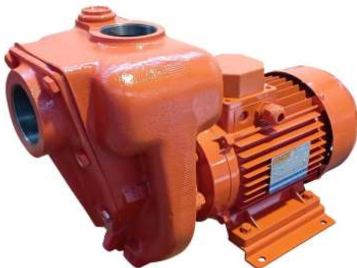
Immagine dimostrativa / Demonstrative image