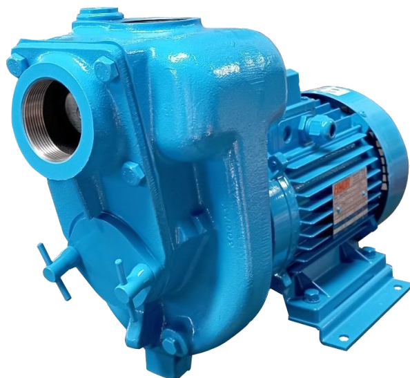
Immagine dimostrativa / Demonstrative image